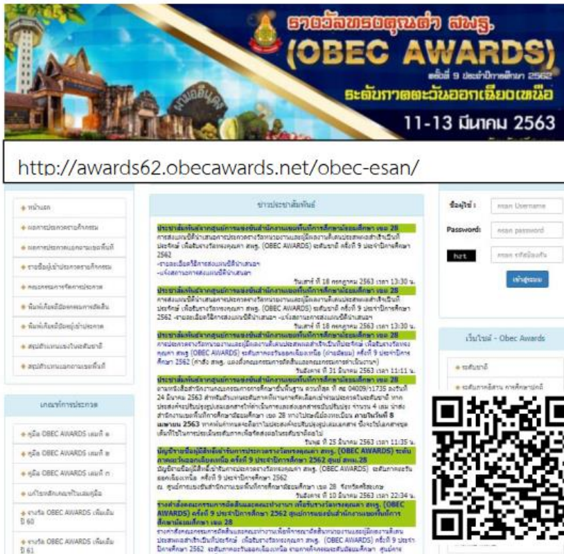
ภาพที่ ๑ หน้าเว็บไซต์ AWARDS ๖๒ ระดับภาคตะวันออกเฉียงเหนือ ครั้งที่ ๙ ประจำปีการศึกษา ๒๕๖๓ และ QR CODE เพื่อเข้าเว็บไซต์ AWARDS ๖๒ ระดับภาคตะวันออกเฉียงเหนือ