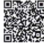
ดาวน์โหลด ดูฉบับตราฯ