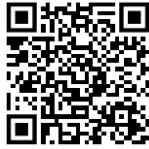
ดาวน์โหลด ประกาศฯ

การนี้ สำนักงานเขตพื้นที่การศึกษามัธยมศึกษาสุรินทร์ ได้แจ้งประชาสัมพันธ์ประกาศรายชื่อ ผู้ผ่านการพัฒนาโครงการพัฒนาข้าราชการครูและบุคลากรทางการศึกษา ก่อนแต่งตั้งให้ดำรงตำแหน่งผู้บริหาร สถานศึกษา ในสังกัดสำนักงานคณะกรรมการการศึกษาขั้นพื้นฐาน ประจำปีงบประมาณ พ.ศ.๒๕๖๙ ผ่าน ระบบ MY-office เป็นที่เรียบร้อยแล้ว โดยผู้ผ่านการพัฒนาโครงการฯ สามารถดาวน์โหลดดูฉบับตร อีเล็กทรอนิกส์ได้ทาง QR - Code