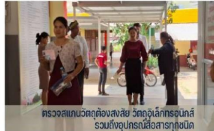
ตรวจสอบเกณฑ์ต้องสงสัย วัตถุประสงค์กรณีนี้ รวมถึงอุปสรรคสื่อสารทุกชนิด

สพม.สุรินทร์ จัดสนามสอบครูผู้ช่วยกรณีที่มีความจำเป็นหรือมีเหตุพิเศษ สังกัดสำนักงานคณะกรรมการการศึกษาขั้นพื้นฐาน ปี พ.ศ. 2567 ภาค ก และ ภาค ข โดยใช้สนามสอบโรงเรียนวีรวัฒน์โยธิน พร้อมนำมาตรการเฝ้าระวังความปลอดภัยและป้องกันการทุจริตมากำหนดใช้อย่างเคร่งครัด