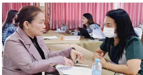
แบ่งกลุ่มสาระร่วมแลกเปลี่ยนและข้อเสนอแนะ

อีกทั้ง ยังจะเป็นการเตรียมการด้านความถูกต้องชัดเจนของข้อมูล และการนำเสนอเพื่อประกอบการยื่นประเมินตำแหน่งฯ และเลื่อนวิทยฐานะครูในสังกัดฯ ต่อไป