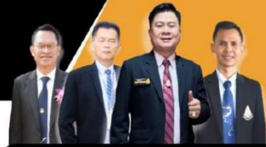
สำนักงานเขตพื้นที่การศึกษาประถมศึกษาสุรินทร์ เงินดี มีความสุข