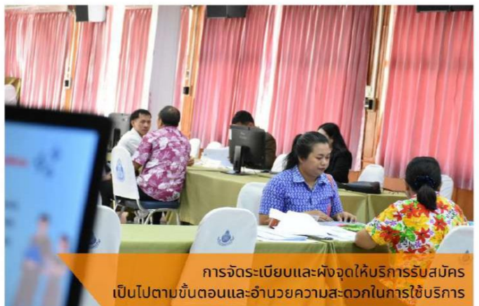
การจัดระเบียบและผังจุดให้บริการรับสมัคร เป็นไปตามขั้นตอนและอำนวยความสะดวกในการใช้บริการ