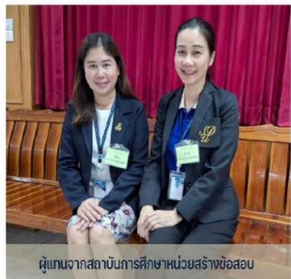
ผู้แทนจากสถาบันการศึกษาหน่วยสร้างข้อสอบ