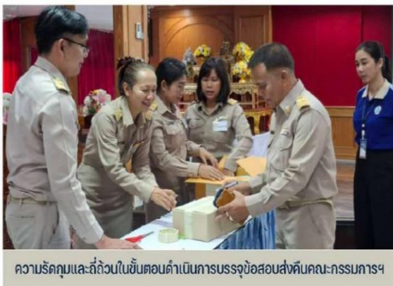
ความรัดกุมและถี่ถ้วนในขั้นตอนดำเนินการบรรจุข้อสอบส่งคืนคณะกรรมการฯ

“การจัดการสนามสอบดีมาก เป็นระบบ มีขั้นตอนการปฏิบัติที่ชัดเจน เข้มงวด ในการนำมาตรการความปลอดภัยมาใช้ อย่างจริงจัง”