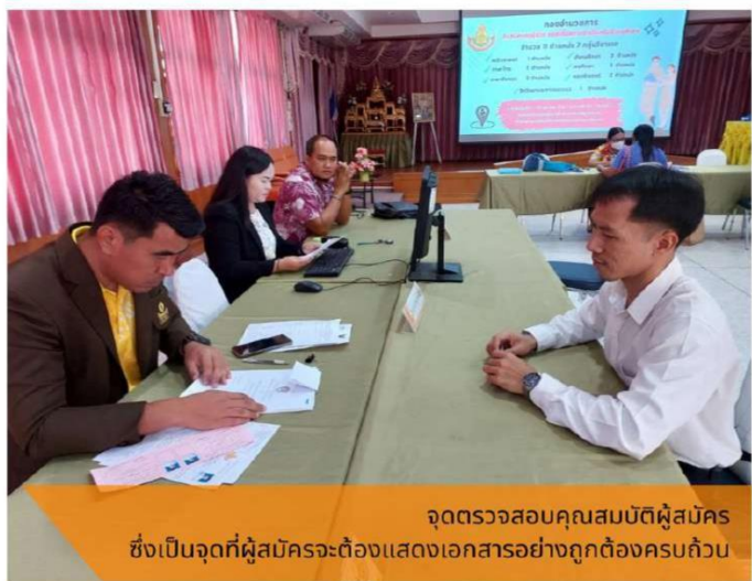
จุดตรวจสอบคุณสมบัติผู้สมัคร ซึ่งเป็นจุดที่ผู้สมัครจะต้องแสดงเอกสารอย่างถูกต้องครบถ้วน