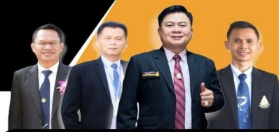
สำนักงานเขตพื้นที่การศึกษามัธยมศึกษาสุรินทร์ เรียนดี มีความสุข