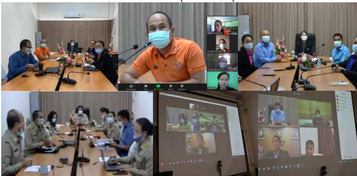
ภาพที่ 5 กิจกรรมสะท้อนผลการนิเทศในภาพรวม โดยผู้บริหารระดับเขตพื้นที่การศึกษาและศึกษานิเทศก์

4.2 ผู้บริหารเขตพื้นที่การศึกษาสะท้อนผล ชื่นชม และเสนอแนะแก่โรงเรียนเพื่อการ ปรับปรุงการบริหารจัดการมัธยมศึกษาให้มีคุณภาพเพิ่มขึ้นต่อไป รวมถึงความห่วงใยที่ส่งต่อไปถึงบุคลากรและ นักเรียนทุกคนในเรื่องของการปฏิบัติตนและความปลอดภัยในการดำรงชีวิตในสถานการณ์การแพร่ระบาดของ โรคติดเชื้อไวรัสโคโรนา 2019 จากนั้นเปิดโอกาสให้ทางโรงเรียนได้อภิปราย และซักถามประเด็นต่าง ๆ เพื่อให้ เกิดความชัดเจนในการพัฒนางานร่วมกันและกล่าวขอบคุณ แล้วปิดประชุมในเวลาที่เหมาะสม ดังภาพที่ 5