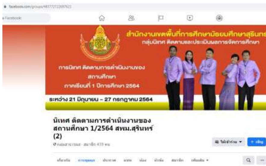
ภาพที่ 2 เพจเฟซบุ๊ก (กลุ่มสาธารณะ) ของกลุ่มนิเทศ ติดตามและประเมินผลการจัดการศึกษา

2. กลุ่มนิเทศ ติดตามและประเมินผลการจัดการศึกษา กำหนดให้โรงเรียนในสังกัดที่เป็นกลุ่มเป้าหมายและครูที่อาสาสมัครเปิดชั้นเรียน (Model Teacher) ตามปฏิทินที่กำหนด ได้นำแผนกำหนดการรับนิเทศของโรงเรียน แผนการจัดการเรียนรู้แบบเชิงรุกที่ผ่านการพัฒนาร่วมกันแล้วในชั้น Plan และลิงก์แอปพลิเคชันที่ครูเลือกใช้สอนบนระบบออนไลน์พร้อมรหัส ไปโพสต์ไว้บนเพจนิเทศ ติดตามการดำเนินงานของสถานศึกษา 1/2564 สพม.สุรินทร์(2) ก่อนวันที่รับการนิเทศ 3 วัน เพื่อให้ศึกษานิเทศก์ได้เข้าตรวจพิจารณานิเทศแผนการจัดการเรียนรู้และให้ข้อเสนอแนะเพื่อปรับปรุงก่อนใช้สอนจริงในวันเปิดชั้นเรียน