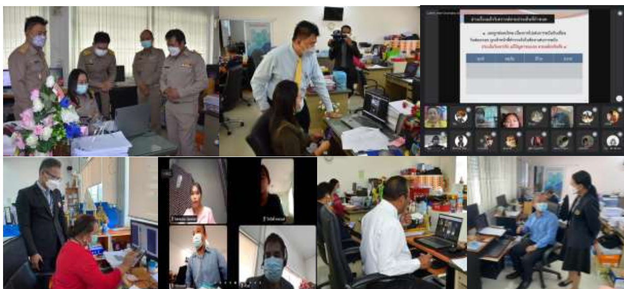
ภาพที่ 4 กิจกรรมเปิดชั้นเรียนแบบออนไลน์ (PLC-LS Online) ของโรงเรียนกลุ่มเป้าหมาย

3. ดำเนินการเปิดชั้นเรียนแบบออนไลน์ (PLC-LS Online) ของแต่ละห้องเรียนในลักษณะการเรียนออนไลน์ตามคาบเวลาที่ครูกำหนด โดยมีทีมครูและศึกษานิเทศก์เข้าร่วม (Sit in) สังเกตชั้นเรียนในชั้น Teach and Observe และเมื่อดำเนินการเปิดชั้นเรียนเรียบร้อยแล้วทุกคนจะร่วมกันประชุมออนไลน์ต่อเนื่องเพื่อดำเนินการสะท้อนผลหลังสอนในชั้น Reflect ดังภาพที่ 4