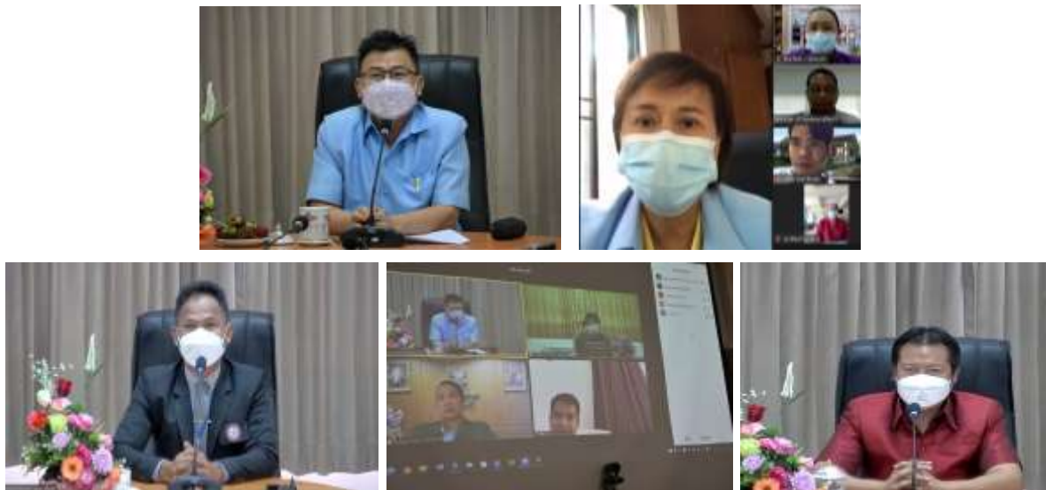
ภาพที่ 3 การประชุมชี้แจงวัตถุประสงค์การนิเทศโดยผู้บริหารเขตพื้นที่การศึกษา ผ่านระบบ Zoom Meeting

2. กำหนดเวลารับการนิเทศ ภาคเช้าเริ่มเวลา 08.45 น. และภาคบ่ายเริ่มเวลา 12.45 น. โดยผู้บริหารโรงเรียนและคณะครูเข้าร่วมประชุมที่ห้องประชุมหลักของสำนักงานเขตพื้นที่การศึกษาสุรินทร์ และเริ่มดำเนินการประชุมชี้แจงวัตถุประสงค์การนิเทศโดยผู้บริหารเขตพื้นที่การศึกษาและศึกษานิเทศก์ ใช้เวลาประมาณ 15 นาที ดังภาพที่ 3