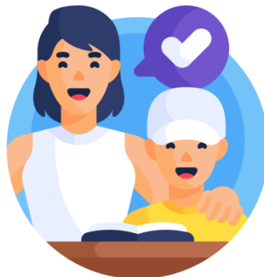
แบบสอบถามสำหรับ ผู้บริหาร ครู ผู้ปกครอง/ กรรมการสถานศึกษา และผู้มีส่วนเกี่ยวข้อง