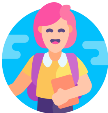
แบบสอบถามสำหรับนักเรียน